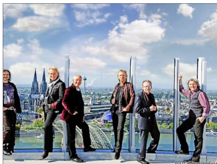
De Höhner sind echte Kölsche Jungs, fühlen sich aber bestimmt auch in der Schweinfurter Stadthalle wohl.

Die Leser von Franken Aktuell Report Kitzingen können außerdem drei Mal zwei Karten gewinnen. Dafür einfach eine E-Mail mit dem Betreff „Höhner“ an die Adresse report.kitzingen@franken.de schicken und folgende Frage beantworten: Wie heißt das Lied, das zur Hymne der handball-WM 2007 in Deutschland wurde? Viel Glück! red